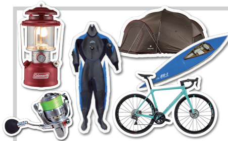
アウトドア・スポーツ